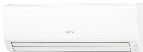
* 18/24 KLCA